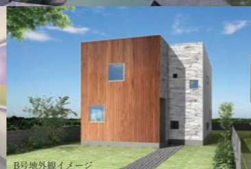
B号地外観イメージ