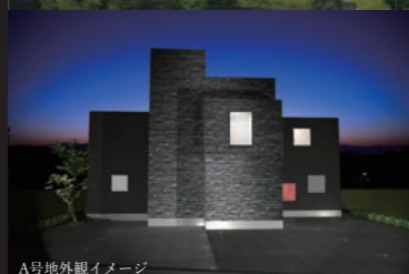
A号地外観イメージ

所在地: 豊中市東豊中町2丁目6-47 ◇交通: 大阪モノレール「少路」駅徒歩10分/北大阪急行線「千里中央」駅徒歩20分 ◇地目: 宅地 ◇用途地域: 第1種低層住居専用地域 ◇建ぺい率: 40% ◇容積率: 80% ◇土地面積: A/247.60㎡、B/300.50㎡、C/300.05㎡ ◇参考価格: A/商談中、B/9,300万円、C/9,800万円 ◇総区画数: 5区画 ◇販売区画数: 2区画 ◇取引形態: 事業主(売主) ◇広告有効期限: 令和1年12月末 ※販売中につき広告配布時に成約済となっている場合がございます。ご了承ください。