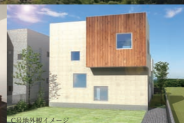
C号地外観イメージ