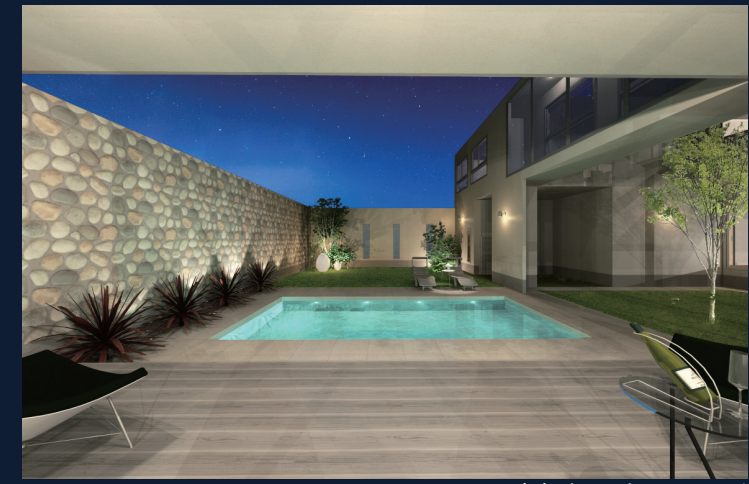
参考プランプールイメージ