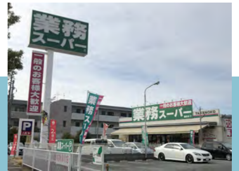
業務スーパー-TAKENOKO(徒歩約5分)