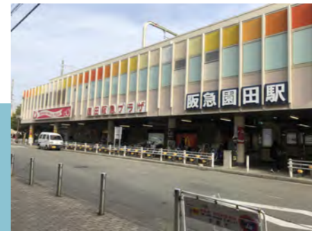
阪急「園田」駅(徒歩約13分)