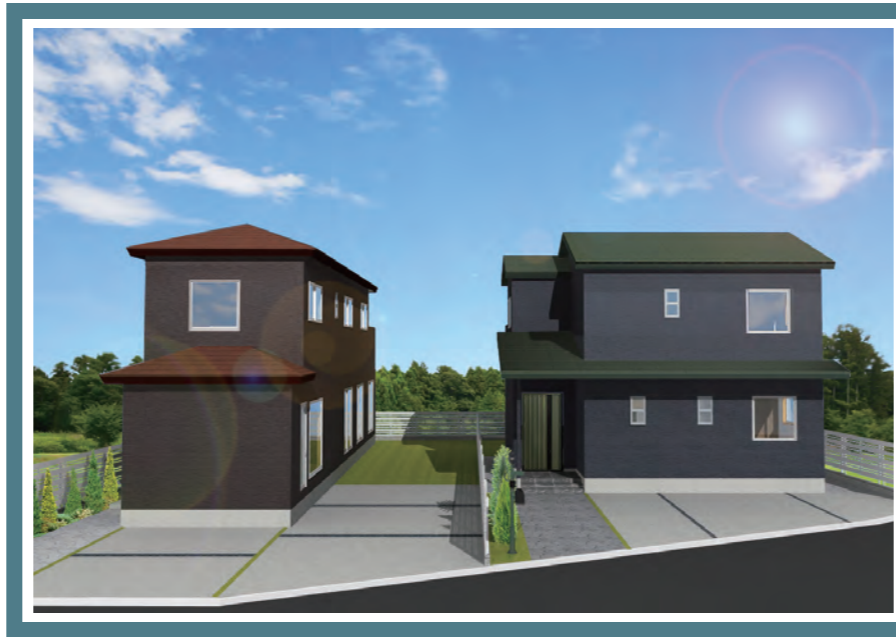
△タウン完成イメージ